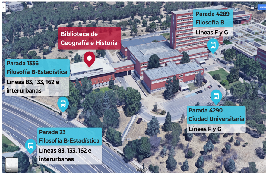
Fig 2. Detalle de la distancia andando a la Facultad de Geografía e Historia, desde la parada de Ciudad Universitaria (línea 6). En la practica la distancia es menor y con ello la duración del trayecto.