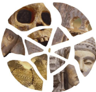
XV Jornadas de Jóvenes en Investigación Arqueológica Madrid 2024

En la propuesta del logo hemos querido mantener la forma original, pero dándole una nueva visión, con un fondo más arqueológico que conecte con el espíritu propio de este congreso.